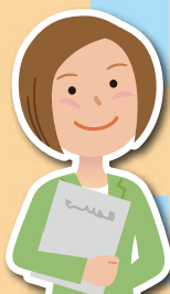
主任ケアマネジャー