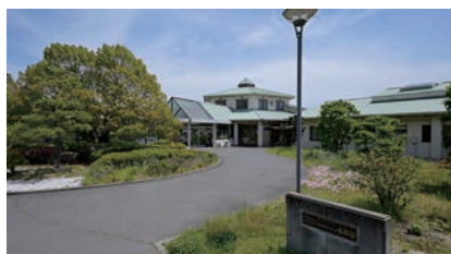
■ 長船地域 長船荘在宅介護支援センター ☎ 0869-26-4772