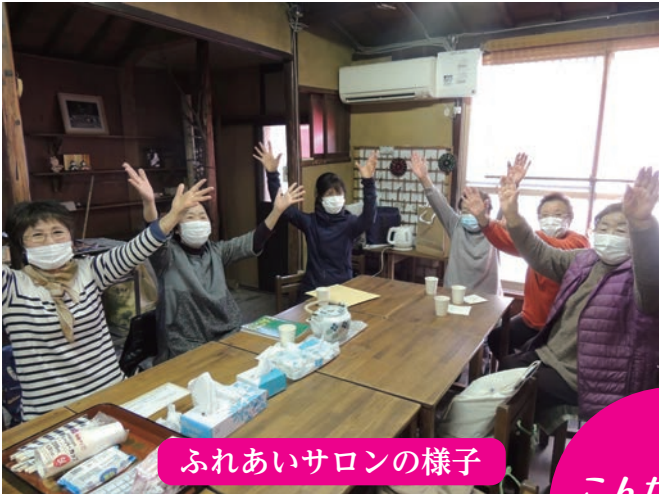
ふれあいサロンの様子

地域のみならず、地域のみなさまからの会費や寄付、共同募金配付金や、市などからの補助金・委託金が財源となっています。これらの貴重な財源は全て、地域を良くするための福祉事業に役立てられています。