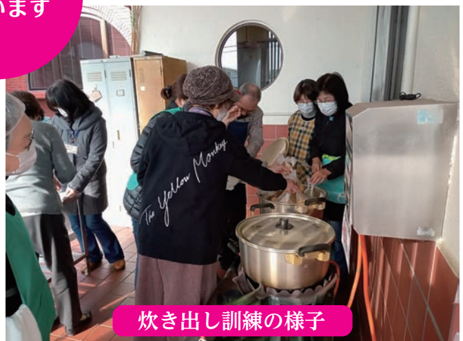
炊き出し訓練の様子