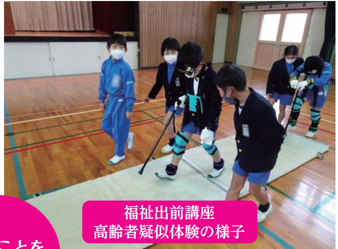
福祉出前講座 高齢者疑似体験の様子