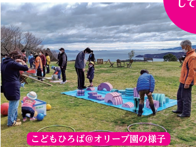
こどもひろば@オリーブ園の様子