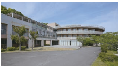
■ 牛窓地域 在宅介護支援センター AJISAI ☎ 0869-34-6368