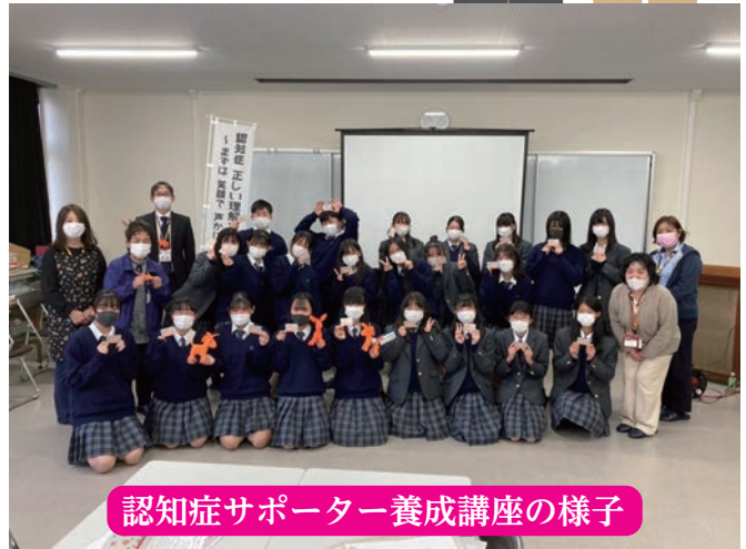
認知症サポーター養成講座の様子

地域でちょっとした助けを必要としている人や、困りごとを抱えている人など、さまざまな福祉課題・生活課題を抱えている人たちの問題を解決し、誰もが安心して住みやすいまちづくりを推進しています。住民のみならず、社会福祉法人、NPO、行政、医療機関など、たくさんの人たちと協力して、「思いやり支え合い みんなで築く 福祉の輪」をスローガンに様々な事業を展開しています。 「ふくしのわ」では社協で取り組んでいる活動や、地域で活躍されている方々をピックアップし情報を発信していきます！