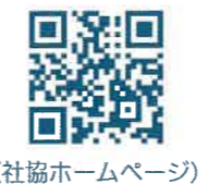
（社協ホームページ）

権利擁護センターほっと♡せとうち（正式名称：瀬戸内市権利擁護センター）は、瀬戸内市より、瀬戸内市社会福祉協議会が受託して運営しており、成年後見制度利用促進基本計画に基づく瀬戸内市の中核機関として位置付けられています。